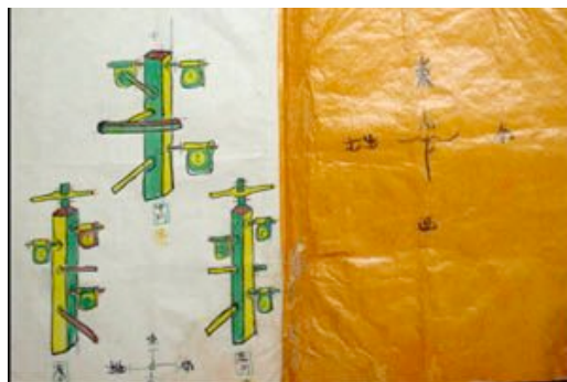
UN MUÑECO DE 3 ESTRELLAS (SAM SING)

En el nivel secundario, varios muñecos son ordenados en formación de 3 estrellas (Sam Sing) con los practicantes trabajando en el centro con los 3 muñecos representados. Nuevo, trabajo de pies, visión periférica, anticipación, y sensibilidad llegan a desempeñar un juego como los variados y diferentes aspectos que cada muñeco tiene diseñado para enfocarse en el. Si usted piensa que solo la práctica del muñeco es impresionante, esto golpea a distancia.